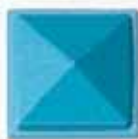
COLORE 3 +20%