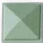
COLORE 4 +20%