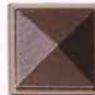
COLORE D +15%