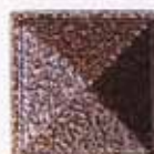
COLORE C +15%