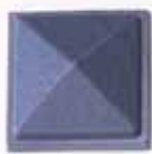
COLORE 2 +20%