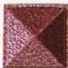
COLORE B +15%