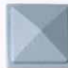
COLORE 6 +20%