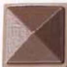
COLORE A +15%