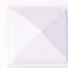
COLORE 5 +20%