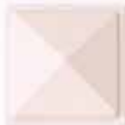
COLORE 7 +20%