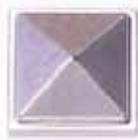
COLORE 1 +20%